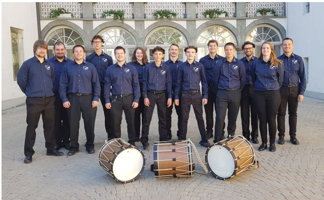
La section des Tambours de la Broye, classée 1 ère en section 3 à Sierre 2019 (Fête romande de fifre et tambour)